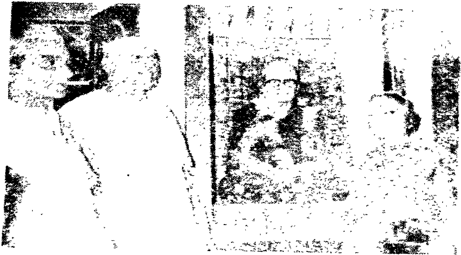
1947లో അമ്മയുടെയും കുഞ്ഞുങ്ങളുടെയും ചിത്രം. ഇടത് വശത്ത് അമ്മയും മധ്യത്തിൽ കുഞ്ഞുങ്ങളും.