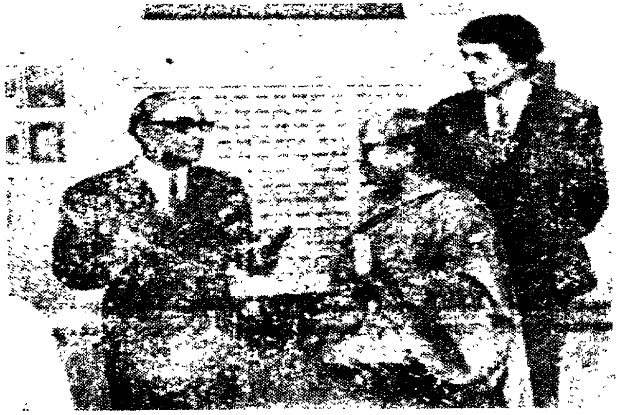
జనశిక్షణ కమిషన్ డైరెక్టర్లు డాక్టర్లు 1972లో జనశిక్షణ కమిషన్ సమావేశం.