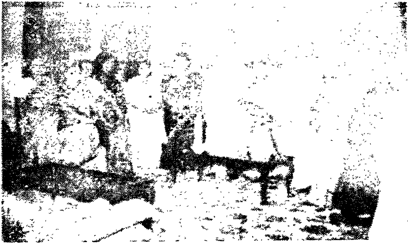
జనశిక్షణ కమిషన్ డైరెక్టర్లు డాక్టర్లు, పాఠశాలలలో పాఠ్యపుస్తకాలను పరిశీలిస్తున్నారు.