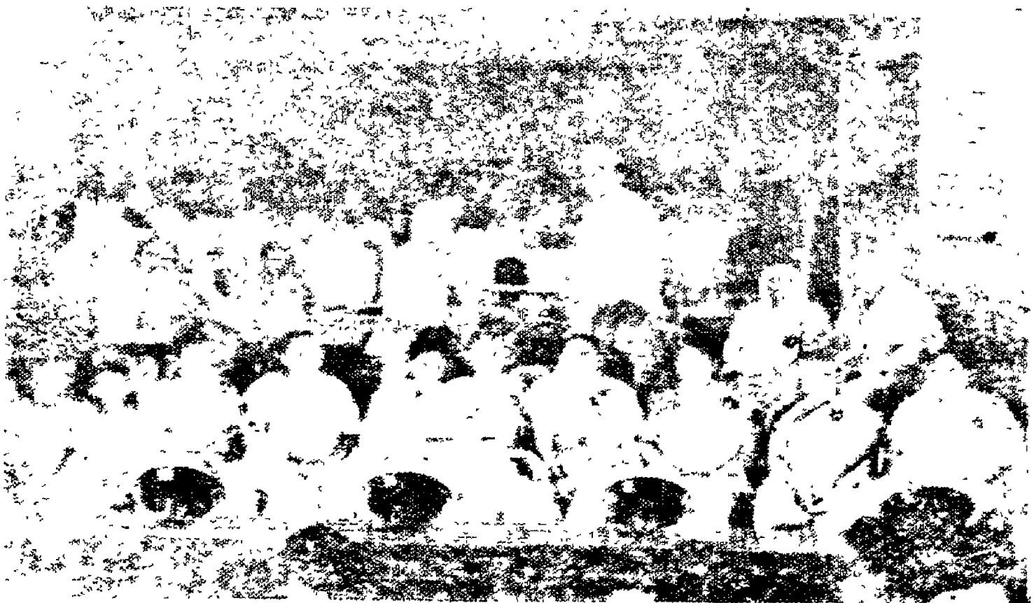
1947లో അമ്മയുടെയും കുഞ്ഞുങ്ങളുടെയും ചിത്രം. ഇടത് വശത്ത് അമ്മയും മധ്യത്തിൽ കുഞ്ഞുങ്ങളും.