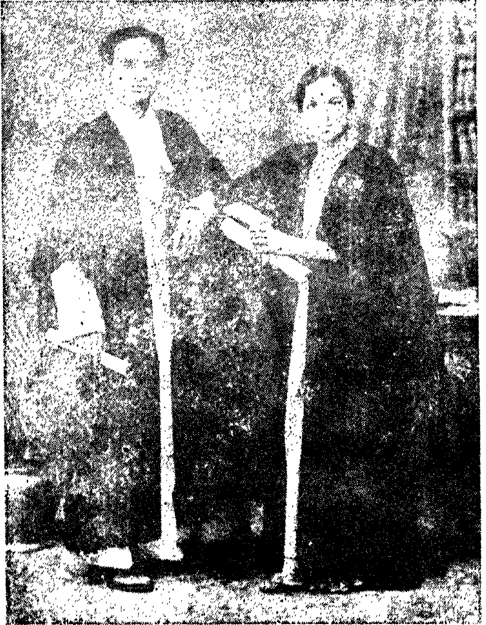
శ్రీహనుగ్రీవ గుప్తాగారు, శ్రీమతి అక్షియా స్తమ్మ దంపతులు 1938లో తీసిన చిత్రం