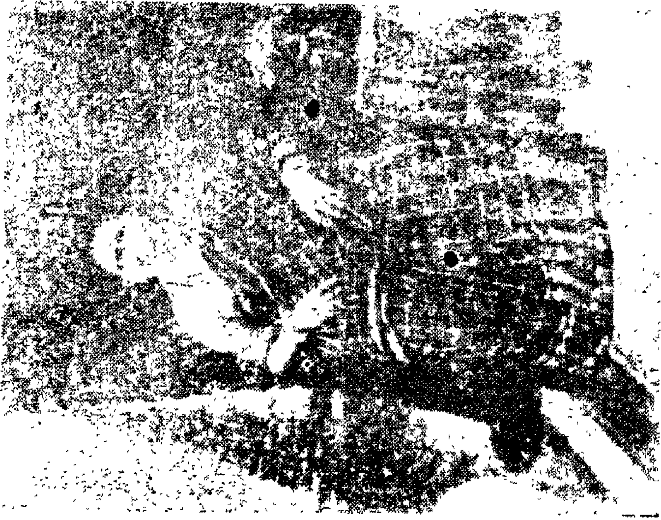
ప్రేమతి లక్ష్మీదాస్ వమ్మ గారి అత్త పొమ్మగార్లు