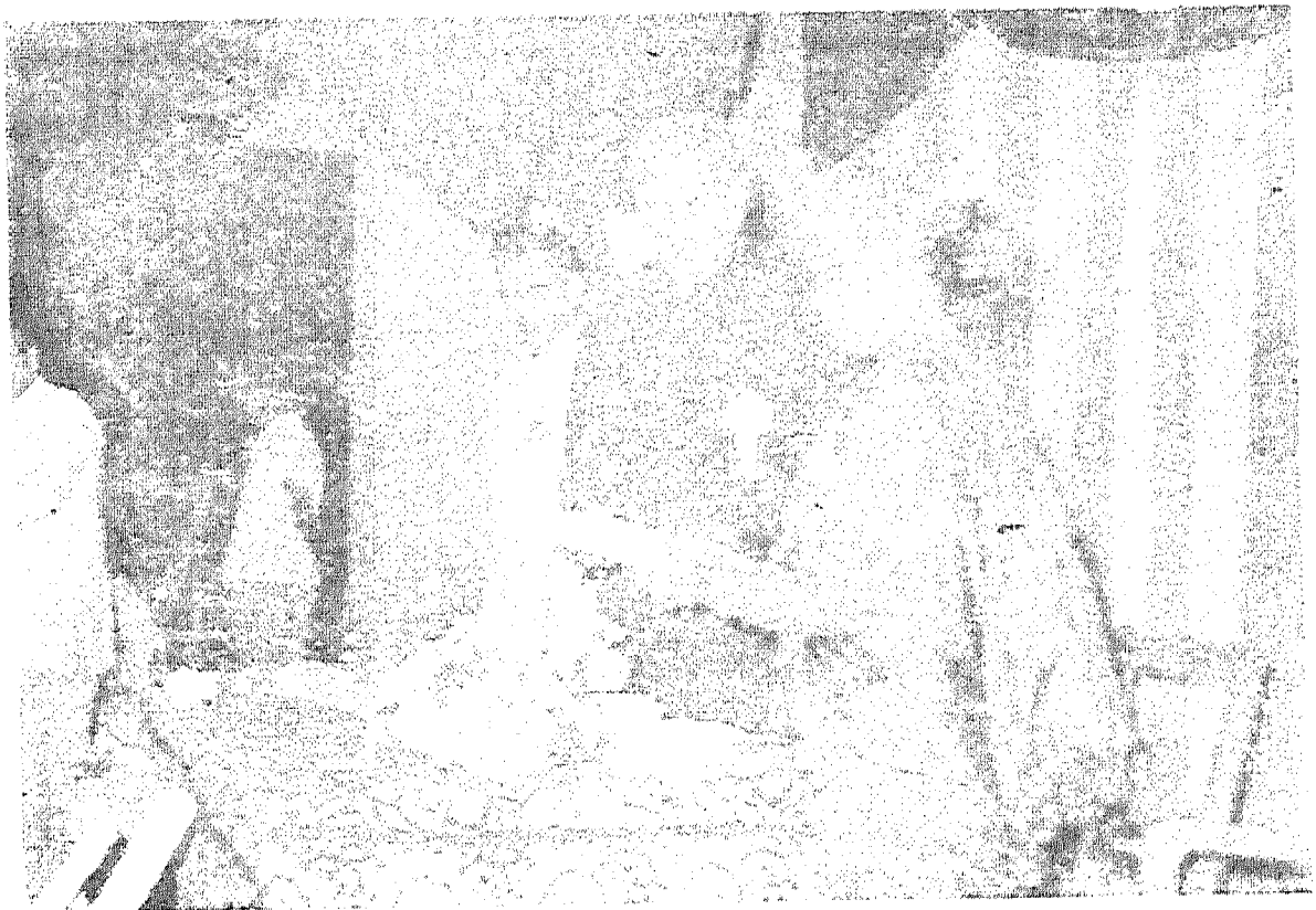
ജനറലിന്റെ കുടുംബം കൊല്ലം ജില്ലയിലെ തിരുവനന്തപുരം